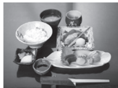
八重洲とよだ 檜物町定食