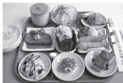
たいめいけん 洋食小皿ランチ

洋食小皿ランチ（9種類の洋食を小皿に。例：国産牛ローストビーフ、ビーフシチュー・温泉玉子添え、牛舌コロッケ、サラダ、カップスープ他 3200円）。また、三越新館B1に姉妹店デリカテッセン・ヒロがごございます。たいめいけんの惣菜を食卓にもいかがでしょうか。ランチは予約が必要です。