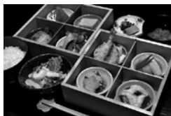
や満登 彩り二段重