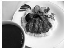
牛フィレ肉のステーキカレー