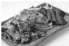
東洋 ミックスグリル定食