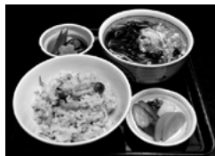
長寿庵 変り御飯セット