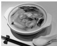
八重洲大飯店 とり煮込みそば

日替りランチ1400円(白飯、その日の1品、サラダ、香物、スープ、デザート)。大好評!! とりめし(中)980円。パリそば850円。とり煮込みそば1200円などご用意しております。