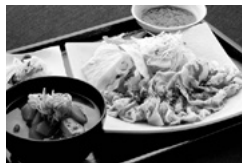
谷崎 冷しゃぶ定食

暑い夏にピッタリの冷しゃぶ定食が一番人気!! タレは定番の青じそおろしポン酢とゴマダレに加え、月替わりのスペシャルの3種類から選べます! その他、大好評の週替りランチ、定番のハンバーグやポークソテー、きじ焼丼などランチは各1000円。先着でトロロな竹製うちわをプレゼント。