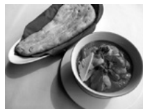
海老のレッドカレー