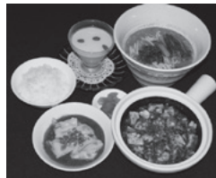
四川飯店 名物セット

四川飯店名物セット1800円。麻婆豆腐、担々麺、うま辛茹でワンタン、ライス、ザーサイ付。ライスはおかわり自由。プラス200円で杏仁豆腐も付けられます。四川飯店の名物料理をご堪能ください。