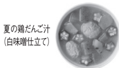
夏の鶏だんご汁 (白味噌仕立て)