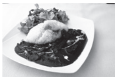
BUNMEIDO CAFE 半熟卵の文明堂ハヤシライス