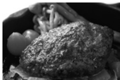
せいとう本店 ハンバーグ