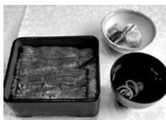
日本橋いづもや本店

うな丼〈笹〉1728円 うな重〈竹〉2592円～。 さらにうな重〈竹〉を2枚使 った一日限定10食の大串蒲 焼2枚付鰻重(肝吸い)、お新 香付、3024円)はかなりお 得!!