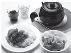
紅花別館 スパイシーなスリランカ風チキンカレー

スリランカ風チキンカレー 1620円 海老のココットカレーグラタン仕立て 1620円 テリヤキビーフのカラフルココモコ 1050円 オムライスコンビ 1050円 1階鉄板焼和牛サービスランチ 6000円