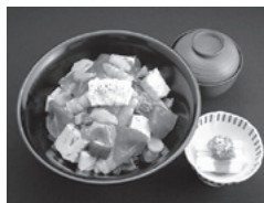
矢の根寿司 ばらちらし

ばらちらし 店主の私が自分の店で一番多く食べるのがこの「ばらちらし」。寿司屋ならどこにでもあるメニューですが、その店の個性がはつきり出てくる一品でもあります。うちの味の狙いは「バランス崩しの妙」に尽きます。お試しあれ! 店主敬白 ランチタイムは午後5時まで。1800円也