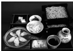
蕎伊豆総本店 じゅげむ定食