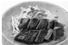
東洋 サービスステーキ定食