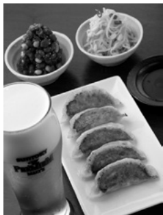
日本橋焼餃子 ビール・餃子セット