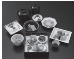
日本橋とよだ 彩御膳

ランチはカロリーバランスの良い彩御膳3780円やとよだ弁当2160円が人気。尚、前日までに予約すれば、会席コースや旬のはも料理も楽しむことができます。