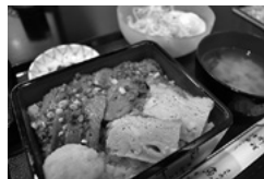
魚十 和風ステーキ重