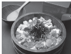
主水 海鮮がいな丼