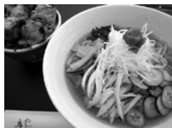
鳥や 冷やしラーメン