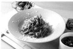
三重テラス 松阪イタリアン