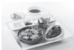
三越 焼きカレープレート