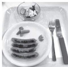
タンネ ソーセージプレートランチ (ブラートヴルストにサラダ)