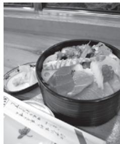
吉野鮨本店 ちらしずし