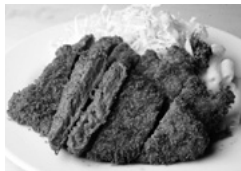
そよいち ビーフカツ

ビーフカツとポークソテーは1800円、ポークカツ1650円、串カツ1100円、ハンバーグステーキ1150円、エビフライ1700円、ミートオムレツ1100円。いずれもライス付き。限定10食のカツカレー(1100円)とメンチカツ(1000円)も好評。