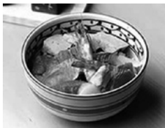
繁乃鮨 特製ちらし