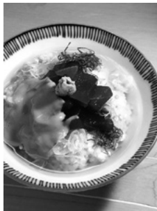
よし梅 冷しまぐろ茶漬け御膳