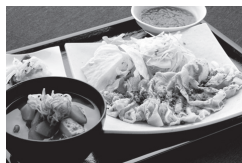
谷崎 冷しゃぶ定食