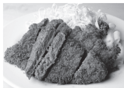
そよいち ビーフカツ

ビーフカツとポークソテーは1800円、ポークカツ1650円、串カツ1100円、ハンバーグステーキ1150円、エビフライ1700円、ミートオムレツ1100円。いずれもライス付き。限定10食のカツカレー(1100円)とメンチカツ(1000円)も好評。 出前: 全品2人前より可能。