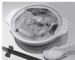
八重洲大飯店 とりそば