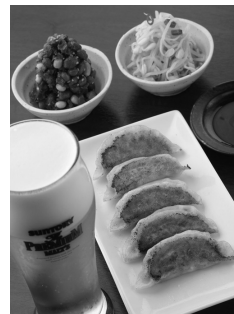
日本橋焼餃子 ビール・餃子セット