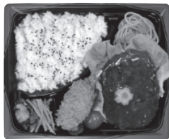
キュルノンチュエデリ スギモト 松阪牛入りハンバーグ弁当