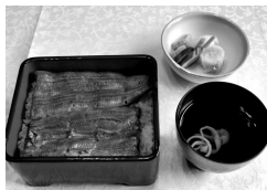
日本橋いづもや本店

うな丼〈笹〉1728円 うな重〈竹〉2592円～。 さらにうな重〈竹〉を2枚使 った一日限定10食の大串蒲 焼2枚付鰻重(肝吸い)、お新 香付、3024円)はかなりお 得!!