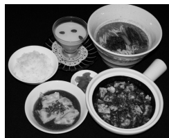
四川飯店 名物セット