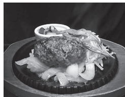
せいとう本店 ハンバーグ