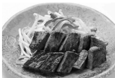
東洋 サービスステーキ定食