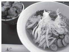
鳥や 冷やしラーメン