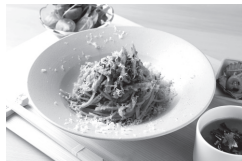
三重テラス 松阪イタリアン

「松阪イタリアン」松阪牛を贅沢にミートソースに仕立てパスタ料理としてご用意いたします。ごく粗くひいた松阪牛がごろごろ入っています。それに三重から届いたお取り寄せ小鉢三種類と合わせて1800円、その他伊勢エビなど三重を代表する食材をランチタイムから堪能して頂けます。