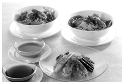
ロイヤルパークホテル