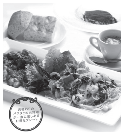
ダノイ ワンプレートランチ