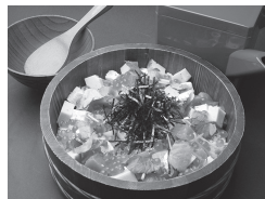
主水 海鮮がいな丼