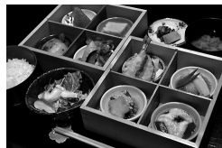
や満登 彩り二段重