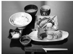
八重洲とよだ 檜町定食