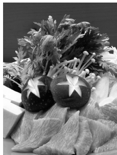
よし梅 ねぎま鍋セット