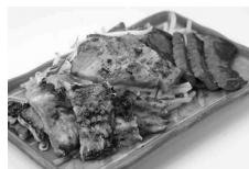
東洋 ミックスグリル定食